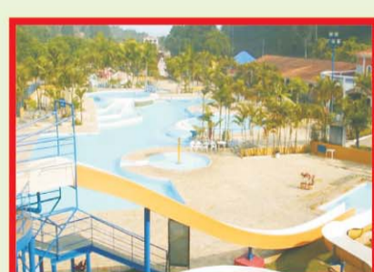
Hotéis e Pousadas a preços especiais