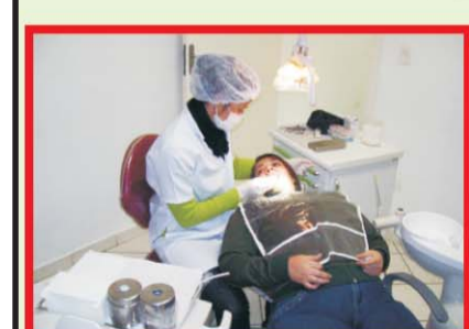
Atendimento Odontológico gratuito