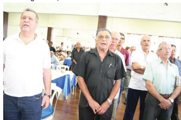
E todos cantaram juntos o Hino da Guarda Civil